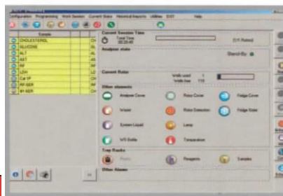
• Interfaz gráfica de fácil utilización • Funciones automáticas con los botones "Auto"